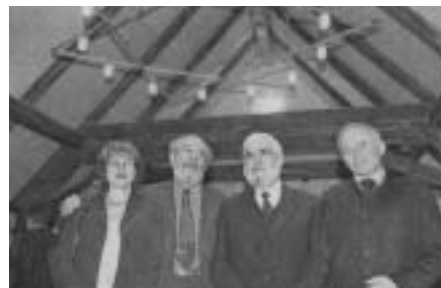
Mit der Fertigstellung des rund 100 Quadratmeter großen Saals unter dem Dach ist die Sanierung des historischen Gemeindehauses abgeschlossen!