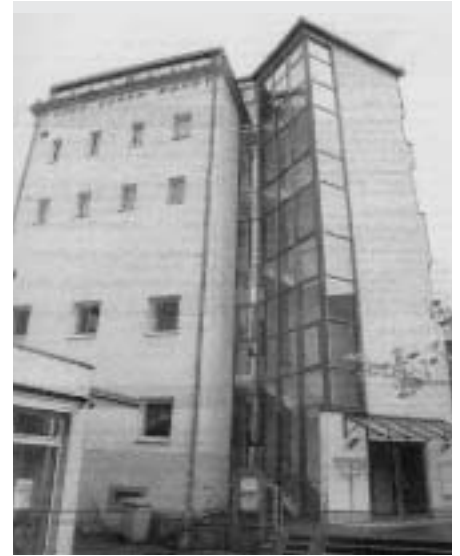
Hoch über den Dächern Emmendingens feiert die jüdische Gemeinde ihre G'ttesdienste und Feste. Seit Oktober 2003 dient der ehemalige »Gastroturm« als neue Synagoge. Und für die Kleinen und Senioren als Jugendclub und Unterrichtsraum

Еврейская жизнь в Эммендингене. А существует ли она вообще? Да! Существует! Есть Община; есть Синагога; есть общинный дом; есть музей со старой Миквой. А кроме того старое и новое Еврейское кладбище. 12 февраля 2005 года община торжественно отпраздновала одновременно 10-летний юбилей и открытие нового зала торжеств в общинном доме.