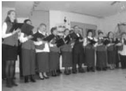
Chor der Gemeinde feiert Jubiläum

Die Fortschritte des Chors der Gemeinde gehören zu den erfolgreichsten aller Aktivitäten der Gemeinde. Deshalb entschlossen wir uns, deren 2-jähriges Jubiläum am 19. Dezember zu feiern.