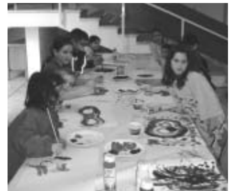
Der Malkurs bei der Arbeit

Die Kinder experimentieren gerne mit Farben, möchten sich austoben und kreativ sein. Sie malen unter anderem mit Acryl- und Wasserfarben, erleben