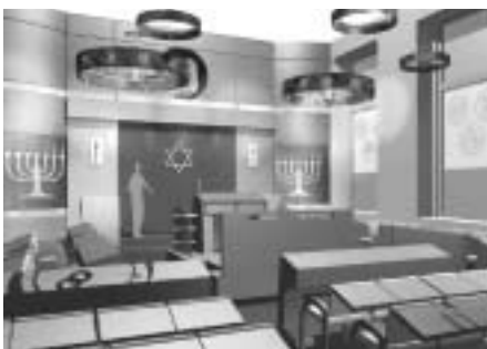
Innenansicht des zukünftigen Gebetraums (Design von Ayal Rosin)

Um die nicht unerheblichen Kosten für die neue Möblierung und Einrichtung bewältigen zu können, rechnen wir mit einer tatkräftigen Unterstützung seitens des Fördervereins ProSynagoge.