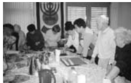
Mitglieder der Gemeinde beim Backen