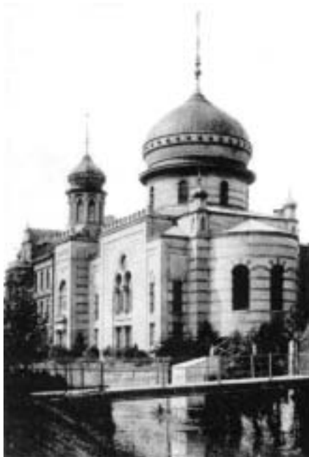
1812 geweihte Synagoge der Gemeinde Pforzheim die 1939 zerstört wurde